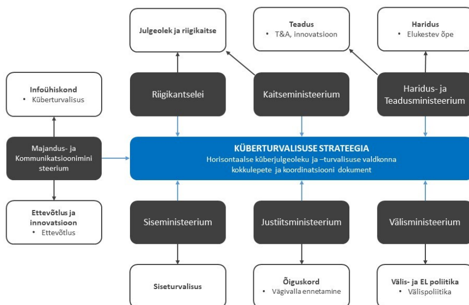
Joonis2. Küberturvalisuse strateegia eesmärkide elluviimiseks vajalike tegevuste planeerimisega seotud tulemusvaldkonnad